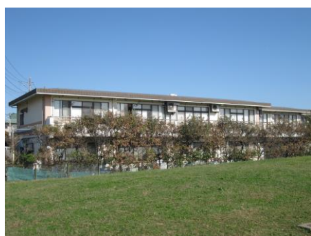
鎌倉海浜公園に面した明るい立地

今年、2013年5月1日で私どもの特養鎌倉静養館（特別養護老人ホーム）は設立30周年を迎えました。地域に開かれた都市型特別養護老人ホームとして、神奈川県・鎌倉市のご援助と市民の皆様のご支援によって鎌倉市由比ガ浜に1983年（昭和58年）5月1日に設立しました。当時の施設長が「鎌倉静養館が今建っている所は3年前には全くの荒地でした。しかし、現在は50人の御老人在生活する憩いの場となっています。地域の方々も入浴・食事に来られ、又機能回復にも励んでおります」と挨拶をしています。鎌倉市では県立七里ガ浜ホームに次ぐ2番目の特別養護老人ホームです。