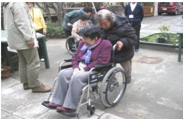
昨年のボランティア講座