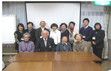
昨年のボランティア講座修了式