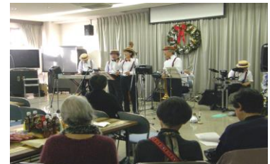
昨年のボランティア感謝の集い