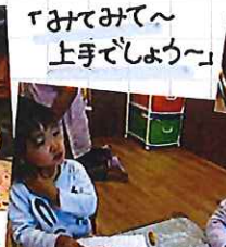
「みてみて〜 上手でしょう〜」