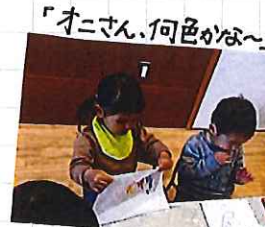
「オニさん、何色かな〜」