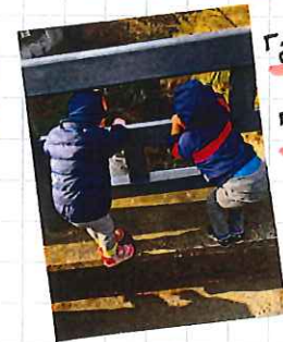
「みてみて〜」 「魚がいるよ〜」 「鳥もいる!!」