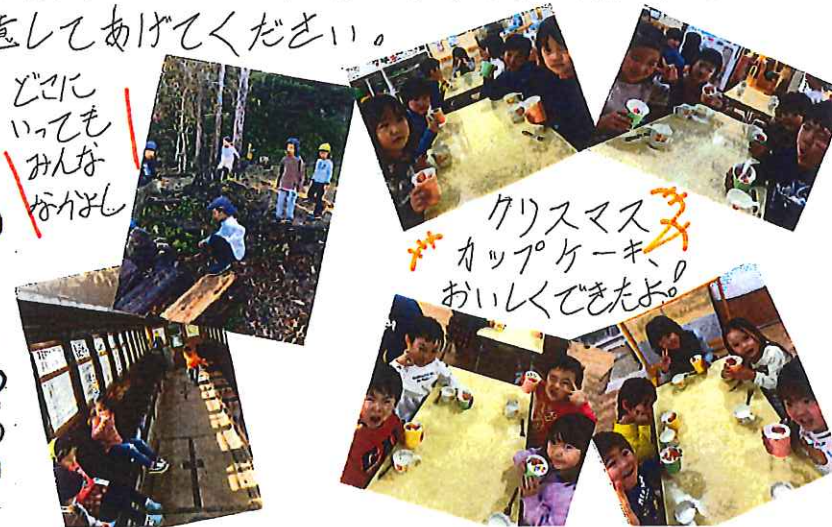
クリスマス カップケーキ、 おいしくできたよ!