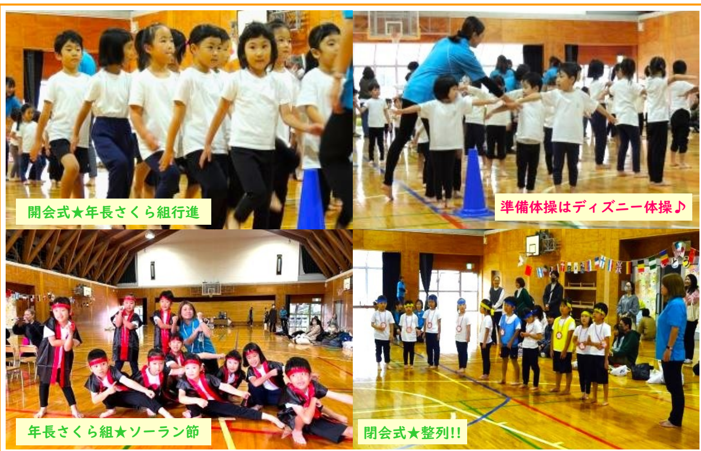
開会式★年長さくら組行進