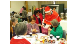
ボランティア感謝会