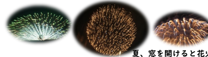
夏、窓を開けると花火大会