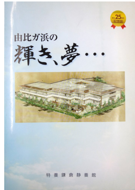
創立25周年記念誌発行