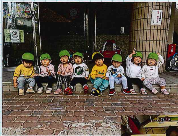
←ぶじゅうぐみのおともだち♡