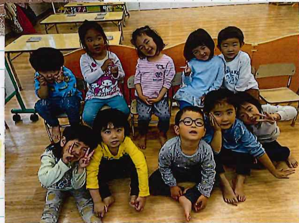
↓あさがおぐみのおともだち♡